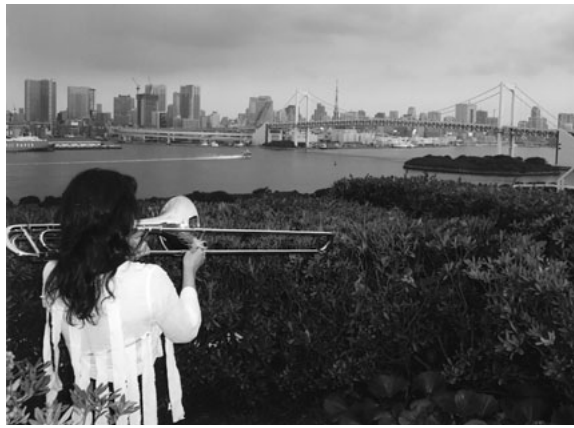
皆で演奏できる日を願って

ちは。私は音楽と犬がいれば幸せな人間です。県職の時から、ハンドベルチームに入り、そしてトロンボーン