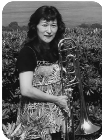
愛用のトロンボーン