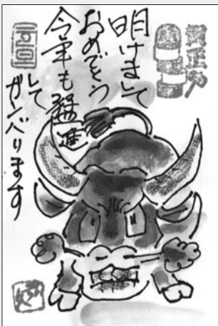
奥津弘久さんの作品