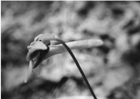
(上) マルバスマイレ(丸葉蕈)。太平洋側の山地に咲く白い蕈(伊勢原・大山)で。昨年4月22日撮影。(下) ナガハシスマイレ(長嘴蕈)。別名「テングスマイレ」。日本海側に咲く雪国の蕈。(斑尾)で。昨年5月25日撮影)