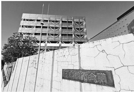
港区六本木にある日本学術会議

まさに憲法で保障されている「学門の自由の侵害」でないか。総理はなぜ任命しなかったかの論点を逸らすために、10億円拠出したから政府の